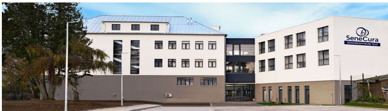
SeneCura SeniorCentrum Telč